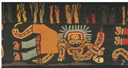
Паракас: 1 – керамический сосуд Паракас кавернас (по А. Сойеру); 2 – фрагмент вышивки Паракас некрополис (по Э. Пол).

платформами из адобов (булкообразных сырцовых кирпичей).