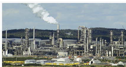
Нефтеперерабатывающий завод близ г. Порт-Морсби.

Добывающая пром-сть получила развитие на базе месторождений цветных и драгоценных металлов, нефти и природного газа. Осн. проблемы, сдерживающие дальнейшее развитие (в т. ч. расширение видов добываемого сырья), – неразвитость инфраструктуры, неурегулированные вопросы землевладения, нестабильность внутр. обстановки.