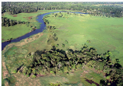
Ландшафт равнины Транс-Флай.