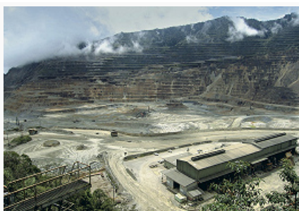
Добыча медных руд на месторождении Ок-Теди. Ok Tedi Mine CMCA Review

месторождение по добыче медных руд – Ок-Теди (в пров. Западная, разрабатывается компанией «Ok Tedi Mining»; в значит. объёмах добывают также золото и серебро). Крупнейшие месторождения золота (по объёмам добычи): Лихир (о. Лихир, пров. Новая Ирландия, разработку ведёт австрал. компания «Newcrest Mining»), Поргера (пров. Энга, оператор – совместное с канад. компанией «Barrick Gold Corporation» предприятие «Porgera Joint Venture»; попутно добывается серебро), Симбери (с 2008; о. Симбери, пров. Новая Ирландия, австрал. «St Barbara Limited»). Крупнейшее месторождение серебряных руд – Хидден-Валли (пров. Моробе, разрабатывается с 2010 компаниями «Newcrest Mining» и