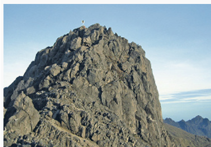
Гора Вильгельм.

В вост. части о. Новая Гвинея и на большинстве др. островов страны преобладает горный рельеф. Высота значит. части территории св. 1000 м, некоторые вершины Новой Гвинеи достигают 4500 м. Б. ч. из 18 действующих вулканов находится на севере страны. От границы с Индонезией на о. Новая Гвинея протягиваются хребты Виктор-Эмануил и Турнвальд – продолжение гор Маоке; затем они переходят в хребты Централ-Рейндж и Бисмарка (с наивысшей точкой страны – горой Вильгельм, выс. 4509 м) – самые высокие и обширные горные системы страны. Сев. склоны гор крутые, южные – пологие. Юж. предгорная зона хребта Централ-Рейндж, постепенно понижающаяся к морю, образует низменную равнину Транс-Флай выс. до 100 м, сложенную аллювиальными наносами и пересечённую реками, на крайнем юге частично заболоченную. Расположенные к северу от хребта Централ-Рейндж низменные долины рек Сепик и Раму отделяют от них более низкие береговые горы Торричелли (выс. до 1859 м). Близ берега поднимаются неск. вулканич. островов (о. Манам – вершина действующего вулкана), много коралловых рифов. К востоку от нижнего течения р. Раму возвышаются горы Аделберт