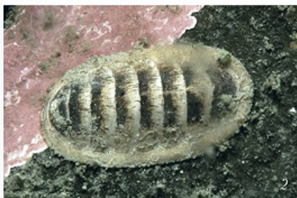
Панцирные моллюски: 1 – Tonicella lineata ; 2 – Leptochiton asellus .