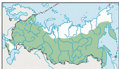
АРЕАЛ ОСИНЫ В РОССИИ

ОСИ́НА, тополь дрожащий ( Populus tremula ), один из видов рода тополь.