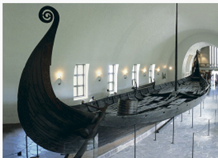
Осебергская ладья. Музей кораблей викингов (Осло, Норвегия).