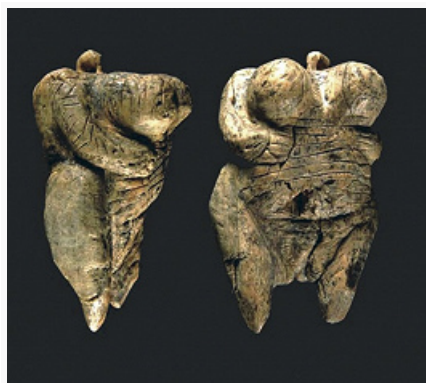
«Венера палеолита» из пещеры Холе-Фельс. Бивень мамонта. Ок. 35 тыс. лет назад (по Н. Конраду).

Вне территории Франции не выделены такие же дробные стадии О. К особенностям ранних памятников О. в Центр. и Вост. Европе относится наличие изогнутой формы у ориньякских пластин с выемками (т. к. выемки на противоположных краях располагаются не симметрично) и др. Затем такие пластины исчезают и осн. признаком остаются нуклевидные резцы и скребки, специфич. микропластинки (аналогичные О. IV и V на территории Франции).