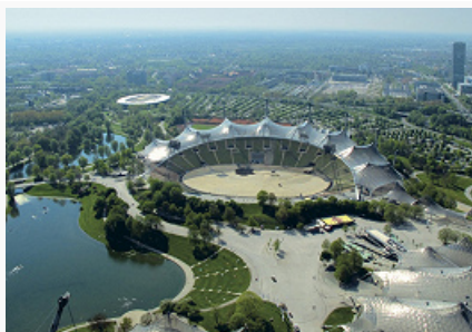
«Олимпиаштадион» в Мюнхене (вид с телебашни).

1) Берлинский «О.» построен в 1934–1936 (первоначальная вместимость ок. 100 тыс. мест) по проекту арх. В. Марха. В сер. 1960-х гг. перестроен, дважды реконструирован к чемпионатам мира по футболу (1974 и 2006); в 2009 прошёл 12-й чемпионат мира по лёгкой атлетике. Домашний стадион футбольного клуба «Герта» (св. 74 тыс. мест).