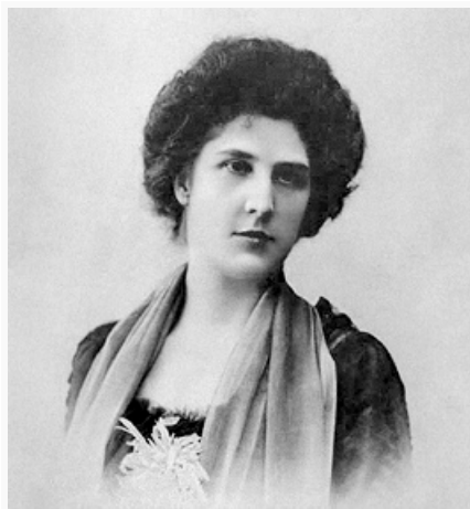
М. А. Оленина-д'Альгейм.

Александр Алексеевич [1(13).6.1865, имение Истомино Касимовского у. Рязанской губ., ныне пос. Крутойарский Касимовского р-на Рязанской обл. – 15.2.1944, Москва], композитор, засл. деят. искусств РСФСР (1927). В 1884–1889 жил в С.-Петербурге, где познакомился с М. А. Балакиревым , занимался по композиции у А. К. Лядова . С 1889 был земским начальником в с. Истомино. Собирал, записывал, обрабатывал нар. песни, с 1922 чл. муз.-этнографич. комиссии ГИМНа в Москве. Его опера «Кудеяр» в 1915 поставлена в Опере С. И. Зимина. Автор сочинений для оркестра, Концерта для фп. с оркестром (1930), инструментальных ансамблей, романсов и песен.