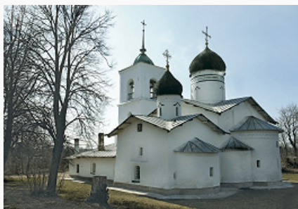
Остров. Церковь Святителя Николая Чудотворца в Застенье. 1542–43. Зодчий Иван Григорьев.