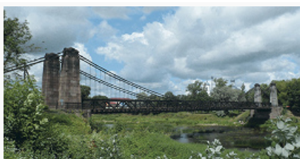
Остров. Висячий цепной мост. 1851–53. Инженер М. Я. Краснопольский. Фото 2009.

Сов. власть установлена в янв. 1918. В 1919, во время Гражд. войны 1917–22, находился вблизи линии фронта. Районный центр Псковского окр. Ленинградской обл. (1927–30, 1935–40), Ленинградской обл. (1930–35, 1940–44), с 1944 Псковской обл. В Вел. Отеч. войну оккупирован герм. войсками 6.7.1941, сильно разрушен. Освобождён частями Красной Армии 21.7.1944 в ходе Псковско-Островской наступат. операции.