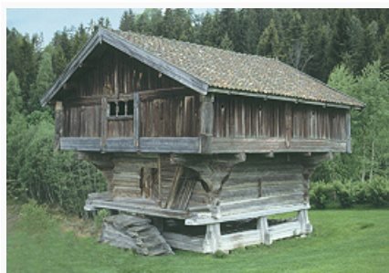
Норвежский лофт. 16 в. Телемарк.

НОРВЕ́ЖЦЫ (nordmenn), 1) население Норвегии; 2) скандинавский народ, осн. население Норвегии. Численность 4,3 млн. чел. (2012, данные Центр. статистич. бюро). Эмигранты из Норвегии и их потомки живут также в США (4,6 млн. чел. норв. происхождения, из них в штате Миннесота 862,4 тыс. чел., штате Висконсин 466,3 тыс. чел., в штате Калифорния 395,5 тыс. чел. – 2010, оценка Бюро переписи), Канаде (432,5 тыс. чел., из них в пров. Альберта 144,6 тыс. чел., Британской Колумбии 129,4 тыс. чел. – 2006, перепись), Швеции (44,8 тыс. чел. – 2005, данные Центр. статистич. бюро) и др. Говорят на норвежском языке . В осн. лютеране.