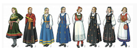
Норвежцы. Локальные варианты женского костюма: 1 – Сетесдал (север фюльке Эуст-Агдер); 2 – Телемарк; 3 – Вестфолл; 4 – Хедмарк; 5 – Хардангер (восток фюльке Хордаланн); 6...

Традиц. комплексы нар. костюма (бюнад) сформировались в период движения за возрождение нац. культуры в сер. 19 в. Мужская одежда – короткие (до колен) штаны, вязанные свитера (люсекофте) и чулки, женская одежда – рубаха с юбкой и корсажем либо с сарафаном, на голове – чепец или полотенчатый убор.