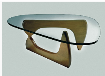
И. Ногучи. Кофейный столик.