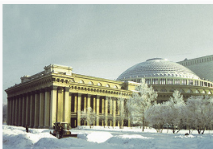
Новосибирский театр оперы и балета. Здание театра.