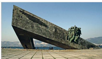
Мемориал «Малая Земля». 1982.

НОВОРОССИЙСК, город в России, в зап. части Краснодарского края. Нас. 246,7 тыс. чел. (2012; третий по числу жителей город края после Краснодара и Сочи); вместе с подчинёнными гор. администрации сельскими населёнными пунктами – 303,1 тыс. чел. Расположен на зап., сев. и восточном берегах незамерзающей глубоководной Цемесской бухты Чёрного м., окаймлён хребтами Большого Кавказа. Важный транспортный центр. Мор. порт. Ж.-д. станция. Узел автодорог. Климатич. особенность района Н. – частая повторяемость сильных сев.-вост. ветров, т. н. новороссийской боры .