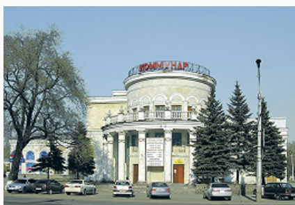
Новокузнецк. Кинотеатр «Коммунар». 1933. Архитектор М. Кассель.

Старейшее поселение на территории совр. Н. возникло в апр. – мае 1618, когда отрядом под команд. О. Харламова-Михалевского, М. Лаврова и О. Кокорева на правом берегу р. Томь основано небольшое зимовье, получившее назв. Кузнецкого острога. Летом 1620 под рук. Т. С. Бобарыкина и О. Г. Аничкова на месте зимовья возведён острог, после 1620 здесь размещался постоянный гарнизон. С 1622 центр уезда. В сер. 1670-х гг. острог представлял собой дерев. крепость с 8 башнями. До нач. 18 в. являлся пограничным форпостом Рус. гос-ва в Юж. Сибири, неоднократно отражал нападения киргизов, томских и кузнецких татар, телеутов и джунгаров (1624, 1633, 1635, 1638, 1640, 1648, 1665, 1667, 1673, 1675, 1682, 1700, 1709). В 1682 в одном из наиболее значительных оборонит. сражений под Кузнецким острогом были разгромлены соединённые силы тувинцев и киргизов. С 1689 город Кузнецк. Уездный город Сибирской (1708–79) и Тобольской (1796–1804) губерний, Колыванской обл. (1779–83), Колыванской губ. (1783–96). В 1717 в Кузнецке возведена первая за Уралом дерево-земляная крепость бастионного типа (после 1750 дерев. укрепления пришли в негодность). В 1799–1820 в Кузнецке в связи с возможной воен. угрозой со стороны Китая возведена каменная крепость (после 1846 передана в гражд. ведение, частично превращена в тюрьму; ныне музей «Кузнецкая крепость»).