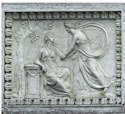
Никольское-Урюпино. Барельеф фасада (со стороны двора) «Белого (Охотничьего) домика». Ок. 1780.

1917. В 1919–29 в усадьбе располагался музей; в 1929 предметы иск-ва и усадебная б-ка распределены между музеями-усадьбами Остафьево , Архангельское и музеем «Новый Иерусалим». Позднее территория Н.-У. передана в ведение Воен.-инж. академии им. В. В. Куйбышева: в 1930-х гг. в окрестностях усадьбы проведён первый в СССР запуск жидкостной ракеты; в Большом зимнем доме были оборудованы лаборатории и опытные цеха, в т. ч. литейный и формовочный, затем до 1991–92 использовался как общежитие курсантов академии; на территории парка устроены плац и фортификац. сооружения. С 2005 (с перерывами) ведётся реставрация.