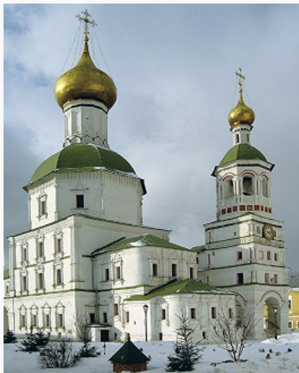
Николо-Перервинский монастырь. Собор Святителя Николая с колокольной. Кон. 17 – сер. 18 вв.