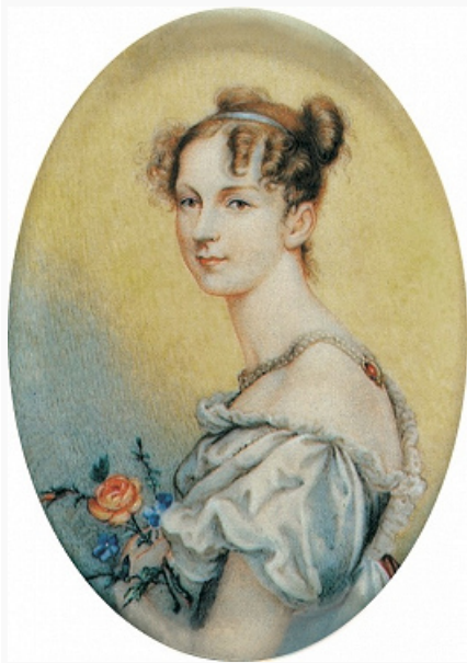
Д. Х. Ливен. Портрет работы неизвестного художника с гравюры 1823(?). Третьяковская галерея (Москва).

Ливен (1839–1913); Никита Александрович [17(29).10.1848 – 6(19).3.1902], тайн. сов. (1900), обер-прокурор 1-го деп-та Сената (1898–1900), сенатор (с 1900). Правнук К. А. Ливена – А. А. Ливен (1860–1914).