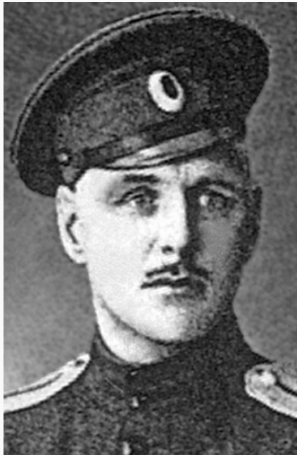
А. П. Ливен.

И. А. Ливен. Портрет работы мастерской Дж. Доу. 1820-е гг. Государственный Эрмитаж (Военная галерея Зимнего дворца, С.-Петербург).