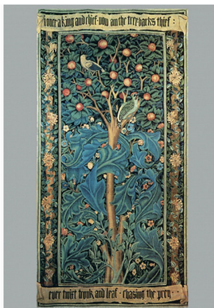
У. Моррис. Гобелен, вытканый (по эскизу художника) в мастерской Мертонского аббатства. 1885. Галерея У. Морриса (Лондон).