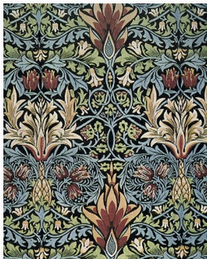
У. Моррис. Рисунок для ткани «Змееголовник». 1876.

МОРРИС (Morris) Уильям (24.3.1834, Уолтемстоу, ныне в черте Лондона – 3.10.1896, Лондон), англ. дизайнер, живописец, обществ. деятель, писатель. Учился в колледже в Марлборо (1848–1851) и Эксетер-колледже Оксфордского ун-та (1853–55), где познакомился с Э. Бёрн-Джонсом , который в дальнейшем стал его соратником по худож. деятельности. Первоначально под влиянием англोकатолицизма собирался стать священником, но поездки по Сев. Франции (1854, 1855), а также труды Т. Карлейля и Дж. Рёскина пробудили в нём интерес к архитектуре и Средневековью, соотношению обществ. устройства и иск-ва; в 1856 он стал учеником работавшего в стиле неоготики арх. Дж. Э. Стрита. В том же году переехал в Лондон, где Д. Г. Россетти убедил его заняться живописью. Под его же влиянием М. и Бёрн-Джонс восприняли худож. принципы прерафаэлитов , примкнув к этому объединению; в 1857 они вместе с Россетти и др. расписали стены и потолок зала заседаний Оксфордского союза сюжетами Артуровских легенд ; к этому же времени относится единственная сохранившаяся станковая работа М. «Прекрасная Изольда» (др. назв. – «Королева Гиневра», 1858, галерея Тейт, Лондон).