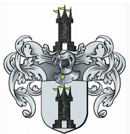
Герб дворянского рода Ламздорфов.

ЛАМЗДОРФЫ, Ламбсдорфы, фон дер Венге Ламздорфы (Lambsdorff von der Wenge), дворянский и графский род нем. происхождения. Фамилия происходит от назв. местечка Ланстроп в Вестфалии (ныне в черте г. Дортмунд, Германия). Во 2-й пол. 16—18 вв. Л. входили в число дворянских (рыцарских) родов Курляндского герцогства . В 18 в. мн. представители рода Л. перешли на рос. службу. Некоторые Л., не вступая в службу, владели имениями в Прибалтике, другие, выйдя в 1874 из рос. подданства, переселились в Германию.