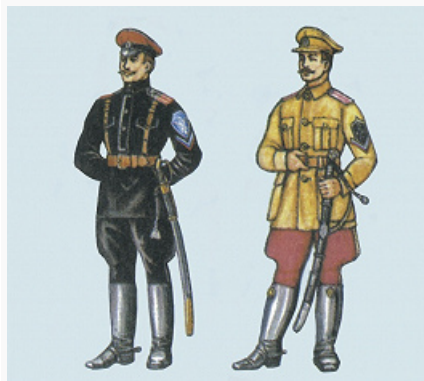
Офицер Корниловского ударного полка (слева). 1919. Офицер 2-го Конного генерала Дроздовского полка (справа). 1919.