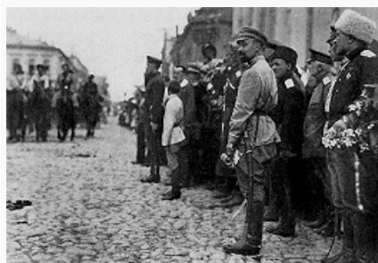
Генерал А. П. Кутепов на смотре частей терских казаков. Харьков.