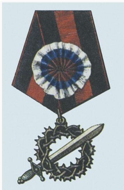
Знак 1-го Кубанского («Ледяного») похода.