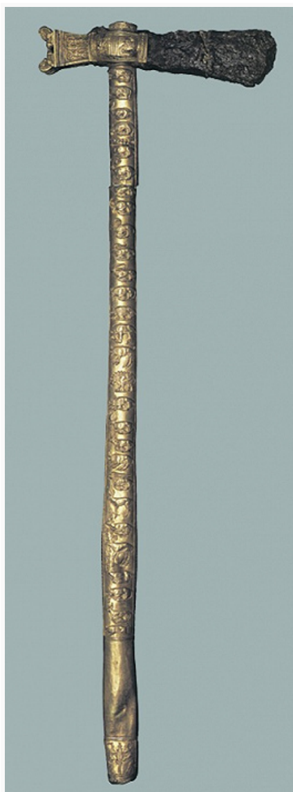
Парадный боевой топор из кургана Келермес-1 (Кубань). Железо, золото. Кон. 7 – нач. 6 вв. до н. э. Эрмитаж (С.-Петербург).

В европ. степях с сер. или кон. 9 до нач. 7 вв. до н. э. доминировала общность, с которой, по мнению ряда исследователей, связаны киммерийцы . С ней находились в тесном контакте племена лесостепи ( чернолесская культура , бондарихинская культура и др.).