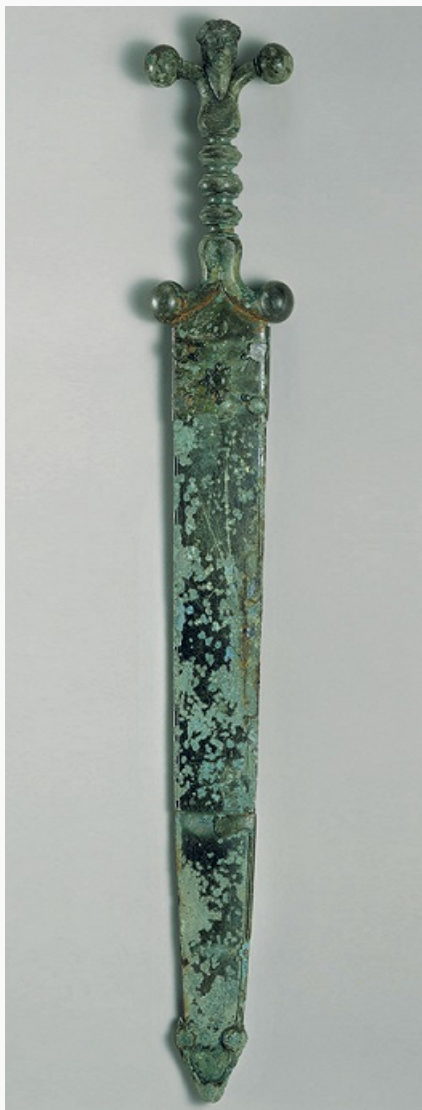
Меч в ножнах с антропоморфной рукояткой. Железо, бронза. Культура Латен (2-я пол. 1-го тыс. до н. э.). Метрополитен-музей (Нью-Йорк).