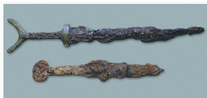
Железные изделия из могильника Барсовский III (Сургутское Приобье). 6–2/1 вв. до н. э. (по В. А. Борзунову, Ю. П. Чемякину).

К 3 в. до н. э. на основе ананьинской складываются общности пьяноборской культуры и гляденовской культуры (см. Гляденово ). Верхней границей культур пьяноборского круга ряд исследователей считают сер. 1-го тыс. н. э., другие выделяют для 3–5 вв. мазунинскую культуру , азелинскую культуру и др. Новый этап историч. развития связан с рядом миграций, в т. ч. появлением памятников круга Харино , приведших к формированию ср.-век. культур, связанных с носителями совр. пермских языков .