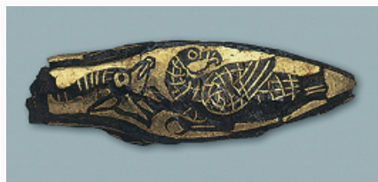
Железный наконечник стрелы, инкрустированный золотом и серебром, из кургана Аржан-2 (Тува). 7 в. до н. э. Эрмитаж (С.-Петербург).

культура сохранялась в низовьях Днепра и в Крыму, где возникло царство со столицей в Неаполе скифском , часть скифов, согласно письм. источникам, сконцентрировалась на Нижнем Дунае; к «позднескифским» ряд исследователей относят и некоторые группы памятников вост.- европ. лесостепи.