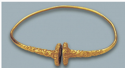
Кельтская золотая гривна из Анконы. 2-я четв. 4 в. до н. э. Национальный археологический музей Марке (Италия).

ГРІВНА, 1) металлическое шейное (от «грива») украшение в виде обруча. В ряде культур, наряду с пекторальями , медальонами, некоторыми ожерельями и др., Г. имели особое значение, что объяснимо представлениями о местоположении души у горла и верхней части груди, ролью верхней части туловища в семантике костюма и др. Известны с бронзового века. У кельтов первоначально Г. (torques) из золота, богато украшенные, входили в облачение знати, затем более скромные Г. получили распространение у воинов, в поздние периоды кельтской культуры Г. встречаются лишь на изображениях (в т. ч. на монетах), в кладах и святилищах, что связывают с приобретением ими сакрально-