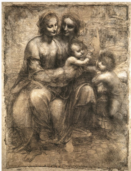
Леонардо да Винчи. «Св. Анна с Марией, младенцем Христом и Иоанном Крестителем». Картон. Ок. 1500. Национальная галерея (Лондон).