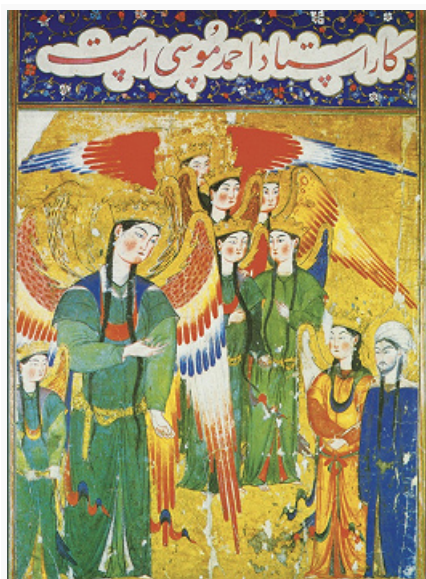
«Пророк Мухаммед и архангел Джабраил перед ангелом-великаном». Миниатюра тебризской школы. Иллюстрация к рукописи «Мираджнаме». 1360–70. Музей Дворца Топкапы (Стамбул).

История Г. начинается в глубокой древности. Некоторые памятники первобытной культуры можно считать «протографикой» (изображения зверей, нанесённые цветной глиной на стене пещеры, процарапанные на кости или камне, и т. п.). В иск-ве Древнего Египта к Г. относятся изображения клеевыми красками на папирусе мифологич. и др. сюжетов, сочетающиеся с идеографич. письмом (иллюстриров. папирусы «Книги мёртвых» эпохи Нового царства). О рисунках художников и архитекторов Древней Греции и Древнего Рима имеются свидетельства современников ( Витрувий , Плиний Старший ), хотя сами произведения не сохранились. До наших дней дошли иллюстрации в рукописных книгах поздней античности («Энеида» Вергилия, 4 в., «Илиада», 5 в.). Живопись ср.-век. Китая и стран Дальневосточного региона по европ. критериям является скорее Г. (кисть, тушь на шёлке и бумаге). В Китае и особенно в Японии 17–19 вв. Г. представлена разл. школами и жанрами гравюры (преим. ксилографии). В исламских странах особое значение приобрели каллиграфия и орнамент, однако изобразительность сохранялась в иран. миниатюре 14–17 вв. и инд. миниатюре 16–18 вв.