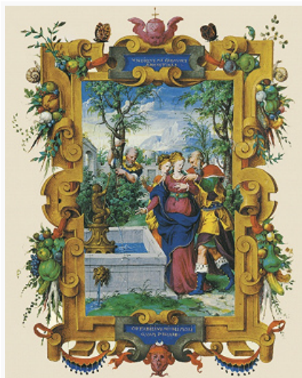
«Сусанна и старцы». Миниатюра из «Часослова коннетабля Анн де Монморанси». 16 в. Музей Конде (Шантийи, Франция).

ГРА́ФИКА (лат. graphice – рисование, черчение; от греч. γραφική τέχνη – искусство письма или рисования), вид изобразит. искусства, основанный на технике рисунка . Г. объединяет законченные рисунки, подготовит. худож. работы (набросок, штудия , эскиз ), репродукционные техники ( гравюра ). Вспомогательную (подготовительную) и замещающую (репродукционную) функции Г. позволяет выполнять дешёвые используемые в ней материалы (прежде всего бумаги как основы большинства графич. произведений; до её изобретения были распространены более дорогие папирус, пергамен, шёлк). Особенности материалов (текстура, фактура), техник и технологий придают произведениям Г. эстетич. своеобразие, отличающее её от живописи.