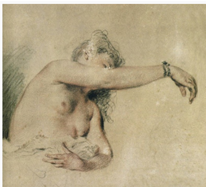
А. Ватто. «Обнажённая с вытянутой рукой». Чёрный, красный и белый мел. 1717–18. Лувр (Париж).

бумаги способствовало и развитию рисунка в 16–18 вв.; на бумаге рисовали сангиной, углем, серебряным штифтом, итал. и свинцовым карандашом, бистром; кистью и пером делали эскизы, наброски, студии с натуры. В эпоху Возрождения начинается систематич. использование рисунка как подготовит. средства для создания произведений станкового и монументального иск-ва (Д. Гирландайо ). В технике Г. создавали и законченные произведения ( Леонардо да Винчи , Микеланджело , Рафаэль , Х. Хольбейн Младший, П. П. Рубенс , Рембрандт, Д. Веласкес , Дж. Б. Тьеполо и др.).