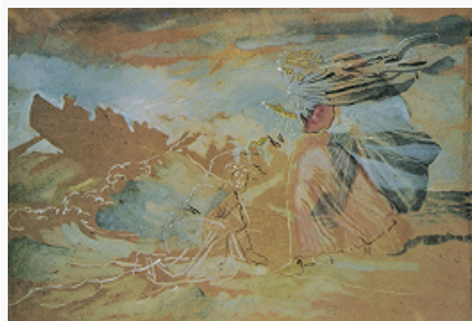
Графика. А. А. Иванов. «Хожение по водам». Из цикла «Библейские эскизы». Акварель, белила, карандаш. 1850-е гг. Третьяковская галерея (Москва).