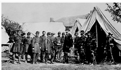
Президент А. Линкольн в федеральных войсках. Октябрь

На 1-м этапе войны (1861–62) единственной целью А. Линкольна и его сторонников было восстановление единства США; вопрос о ликвидации института рабства и судьбе зап. территорий не ставился. В течение полутора лет федеральные войска в осн. терпели поражения в столкновениях с силами КША. Уже в первом серьёзном сражении при Манассасе (или Бул-Ран), близ Вашингтона, 21.7.1861 северяне были разбиты южанами. Два поражения они потерпели при попытке овладеть столицей юж. штатов – Ричмондом (в сражениях 26.6–2.7.1862 на р. Чикахоми и 11–13.12.1862 при Фредериксберге). Однако и попытки южан овладеть Вашингтоном закончились неудачей. 16–17.9.1862 они не смогли взять верх над федеральной армией в битве при Антьетаме и были вынуждены уйти за р. Потомак. На западе и юге войска северян под команд. генералов У. С. Гранта и Б. Батлера при поддержке эскадры адм. Д. Г. Фаррагута заняли Мемфис, Коринф и Новый Орлеан. Северяне блокировали своим флотом порты юж. штатов, лишив их тем самым связи с Великобританией и Францией. Действия крейсеров южан ( «Алабама» и др.) нанесли существенный ущерб торговому флоту северян, но серьёзного влияния на ход войны не оказали.