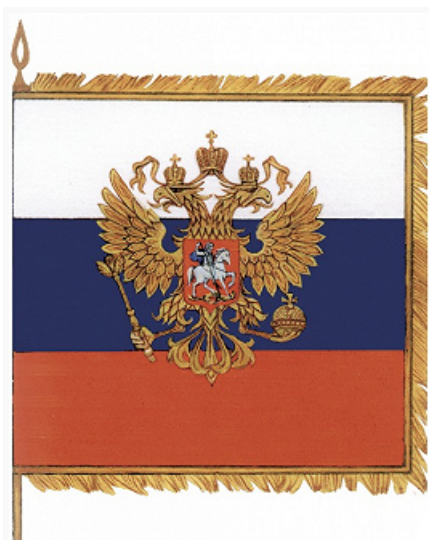
Штандарт Президента РФ.

предприятий, учреждений и организаций независимо от форм собственности, а также на жилых домах в дни гос. праздников Рос. Федерации.