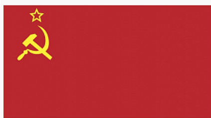
Государственный флаг СССР.

После Февр. революции 1917 в торжественных случаях, а также в армии и на флоте использовались красное знамя, бело-сине-красный и Андреевский флаги. После Окт. революции 1917 декретом ВЦИК от 8.4.1918 Г. ф. РСФСР было объявлено красное знамя с надписью «Российская Советская Федеративная Социалистическая Республика».