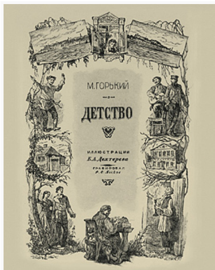
М. Горький. «Детство». Титульный лист работы художника Б. А. Дехтерёва. Москва, 1946.

Вовлечённый в активную политич. деятельность в начале первой рус. революции, Г. был вынужден в янв. 1906 эмигрировать (вернулся в кон. 1913). Пик сознательной политич. ангажированности (социально-демократич. окраски) писателя пришёлся на 1906–07, когда были опубликованы пьеса «Враги» (1906), роман «Мать» (1906–07), публицистич. сб-ки «Мои интервью» и «В Америке» (оба 1906). Вместе с тем уже в написанной годом позже повести «Исповедь» (1908) отразились более широкое мировидение и комплекс филос. идей, связанных с богостроительством (сказалась близость Г. к кругу А. А. Богданова и А. В. Луначарского , вызвавшая недовольство и критику В. И. Ленина).