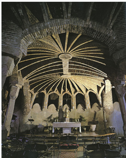
А. Гауди. Интерьер крипты часовни в Санта-Колома. 1903–16.