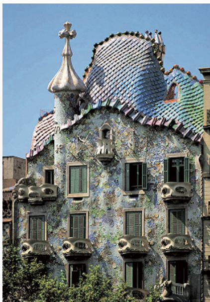
А. Гауди. Фрагмент фасада Каса-Батльо в Барселоне. 1904–06.

Барселоне); проект часовни для рабочего посёлка в Санта-Колома (не завершена, построена только крипта, 1903–16). В 1883 Г. назначен директором строительства барселонского собора Саграда-Фамилия (Св. Семейства; начато по неоготич. проекту арх. Ф. Вильяра), которым занимался до конца жизни. В 1884–91 соорудил крипту и начал фасад вост. трансепта, постепенно разрабатывая собств. концепцию грандиозного храма. В осуществлённом им фрагменте композиции преобладают 4 высокие башни (носят имена апостолов Варнавы, Симона, Фаддея и Матфея; при жизни Г. была завершена только одна башня, др. достроены в 1930); 3-частный портал с обильным декором, напоминающим сталактиты, символизирует Веру, Надежду и Любовь (1903). Все прочие элементы структуры также имеют символич. значение. Закончив возведение одного из фасадов и приходской школы собора (1909), Г. погиб в результате несчастного случая, оставив не воплощёнными многочисл. чертежи и модели. Похоронен в крипте собора,