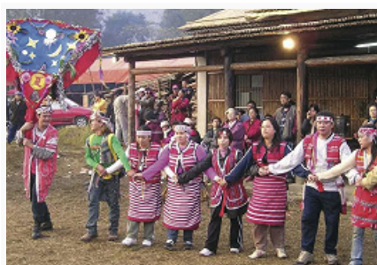
Гаошань. Праздник у сайсиат.

языкам языке ями. Равнинные аборигены Тайваня (кит. пинпу, пепо) живут на западе и севере, часть полностью ассимилирована: кавалан (кабаран, 100 чел.), басаи (включая каукаут и тробиаван), кетангалан (люйлан), таокас, пазех (1 чел.), папора, бабуза (200 чел.), хоанья (включая льоа и арикун), сирая (включая макатао и тайвоан) – почти полностью перешли на кит. яз. и, как правило, официально не признаются в качестве аборигенных народов. Ок. 30 тыс. чел. живёт в городах Шанхай, Пекин, Ухань и в провинции Фуцзянь. По религии в осн. протестанты и католики.