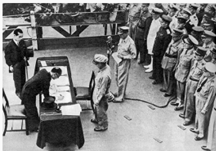
Представитель Японии министр иностранных дел М. Сигемицу подписывает Акт о капитуляции. Сентябрь 1945.