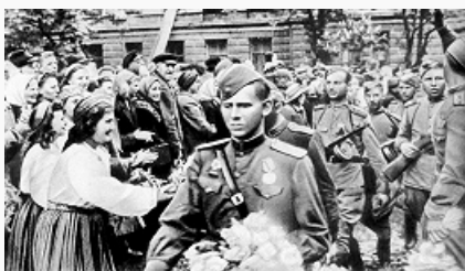
Воины 8-го стрелкового Эстонского корпуса вступают в Таллин. Сентябрь 1944.

Четвёртый период войны (янв. 1944 – май 1945) начался новым наступлением Красной Армии. Сов. войска в 1944 на всём сов.-герм. фронте обрушили на врага сокрушит. удары и изгнали захватчиков из пределов Сов. Союза. В ходе последующего наступления ВС СССР сыграли решающую роль в освобождении Польши, Чехословакии, Югославии, Болгарии, Румынии, Венгрии, Австрии, сев. районов Норвегии, в выводе из войны Финляндии, создали условия для освобождения Албании и Греции. Вместе с РККА в борьбе против нацистской Германии принимали участие войска Польши, Чехословакии, Югославии, а после заключения перемирия с Румынией, Болгарией, Венгрией – и воинские части этих стран. Союзные войска, проведя «Оверлорд» операцию , открыли второй фронт и начали наступление в Германии. Высадившись 15.8.1944 на юге Франции, британо-амер. войска при активной поддержке франц. Движения Сопротивления к середине сентября соединились с войсками, наступавшими из Нормандии, однако герм. войскам удалось выйти из Франции. После открытия второго фронта гл. фронтом В. м. в. продолжал оставаться сов.-герм. фронт, где действовало в 1,8–2,8 раза больше войск стран фашистского блока, чем на др. фронтах.