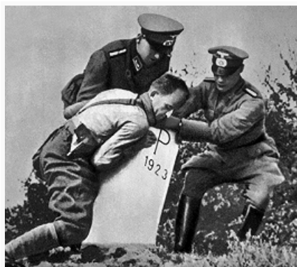
Гитлеровцы уничтожают пограничный знак на германо-польской границе. 1939.

В. м. в. началась 1.9.1939 нападением Германии на Польшу. К 1.9.1939 численность ВС Германии достигла св. 4 млн. чел., на вооружении находилось ок. 3,2 тыс. танков, св. 26 тыс. арт. орудий и миномётов, ок. 4 тыс. самолётов, 100 боевых кораблей осн. классов. Польша имела ВС численностью ок. 1 млн. чел., на вооружении которых находилось 220 лёгких танков и 650 танкеток, 4,3 тыс. арт. орудий, 824 самолёта. Великобритания в метрополии имела ВС численностью 1,3 млн. чел., сильные ВМС (328 боевых кораблей осн. классов и св. 1,2 тыс. самолётов, из них 490 в резерве) и ВВС (3,9 тыс. самолётов, из них в резерве 2 тыс.). ВС Франции к концу авг. 1939 насчитывали ок. 2,7 млн. чел., ок. 3,1 тыс. танков, св. 26 тыс. арт. орудий и миномётов, ок. 3,3 тыс. самолётов, 174 боевых корабля осн. классов. 3 сент. Великобритания и