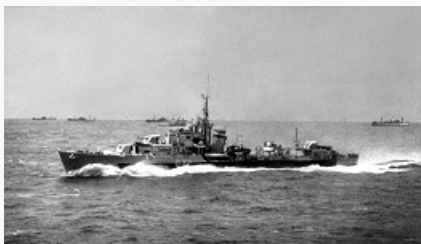
Конвой союзников возвращается из северных портов СССР. Фото 1944.