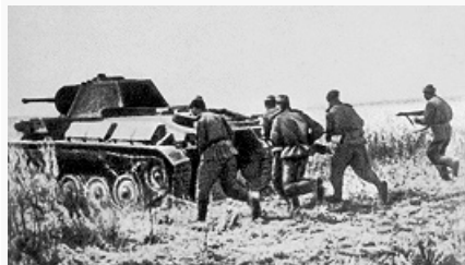
Курская битва. Советские танки во взаимодействии с пехотой контратакуют противника. Июль 1943.

Осн. события В. м. в. в 1942–1943 развивались на сов.-герм. фронте. К нояб. 1942 здесь действовали 192 дивизии и 3 бригады вермахта (71% всех Сухопутных войск) и 66 дивизий и 13 бригад союзников Германии. 19 нояб. началось контрнаступление сов. войск под Сталинградом (см. Сталинградская битва 1942–43 ), завершившееся окружением и разгромом 330-тысячной группировки герм. войск. Попытка герм. группы армий «Дон» (команд. – ген.-фельдм. Э. фон Манштейн ) деблокировать окружённую группировку ген.-фельдм. Ф. фон Паулюса была сорвана. Сковав гл. силы вермахта на моск. направлении (40% герм. дивизий), сов. командование не позволило перебросить на юг резервы, необходимые Манштейну. Победа сов. войск под Сталинградом стала началом