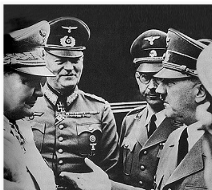
Военные руководители Германии в

10.6.1940 вступила в войну на стороне Германии Италия (в 1939 её ВС насчитывали св. 1,7 млн. чел., ок. 400 танков, ок. 13 тыс. арт. орудий и миномётов, ок. 3 тыс. самолётов, 154 боевых корабля осн. классов и 105 ПЛ). Итал. войска в августе захватили Брит. Сомали, часть Кении и Судана, в сентябре вторглись из Ливии в Египет, где были остановлены и в декабре разбиты брит. войсками. Попытка итал. войск в октябре развить наступление из оккупиров. ими в 1939 Албании в Грецию была отражена греч. армией. На Дальнем Востоке Япония (к 1939 в составе её ВС находилось св. 1,5 млн. чел., св. 2 тыс. танков, ок. 4,2 тыс. арт. орудий, ок. 1 тыс. самолётов, 172 боевых корабля осн. классов, в т. ч. 6 авианосцев с 396 самолётами, и 56 ПЛ) заняла юж. районы Китая и оккупировала сев. часть франц. Индокитая. Германия, Италия и Япония 27 сент. заключили Берлинский (Тройственный) пакт (см. Пакт трёх держав 1940 ).