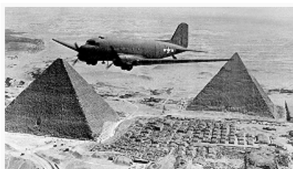
Американский транспортный самолёт С-47 выполняет задание в Египте. 1943.

коренного перелома в Вел. Отеч. войне и оказала большое влияние на дальнейший ход всей В. м. в. Она подорвала престиж Германии в глазах её союзников, породила у самих немцев сомнение в возможности победы в войне. Красная Армия, захватив стратегич. инициативу, развернула общее наступление на сов.-герм. фронте. Началось массовое изгнание врага с территории Сов. Союза. Курской битвой 1943 и выходом на Днепр был завершён коренной перелом в ходе Вел. Отеч. войны. Битва за Днепр 1943 опрокинула расчёты противника на переход к затяжной позиционной оборонит. войне.