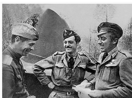
Лётчики французского авиационного полка «Нормандия» беседуют с советским пилотом. 1944.

В апреле – мае соединения Красной Армии разгромили в Берлинской операции 1945 и Пражской операции 1945 последние группировки герм. войск и встретились с войсками союзников. Война в Европе окончилась. Безоговорочная капитуляция Германии была принята поздно вечером 8 мая (в 0 ч 43 мин 9 мая по моск. времени) представителями СССР, США, Великобритании и Франции.