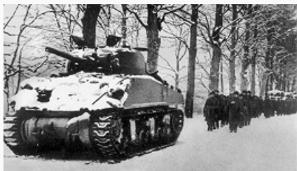
Войска союзников в Арденнах. Декабрь 1944.