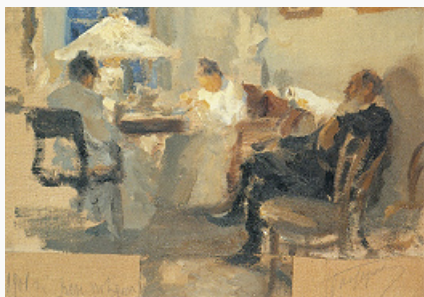
Л. О. Пастернак. «Л. Н. Толстой