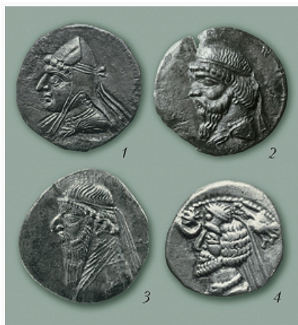
Аверсы монет Парфянского царства: 1 — Аршака I (ок. 247–211 до н. э.); 2 — Митридата I (ок. 171–138 до н. э.); 3 — Митридата II (ок. 123–88/87 до н. э.); 4 — ...

дискуссионными [в т. ч. суть события, положившего начало «парфянской эре» (с 247 до н. э.), полный список царей]. В отношении становления П. ц. большинство совр. исследователей приняло концепцию польск. историка Й. Вольского, показавшего, что данные традиции, представленной у Юстина и Страбона , более достоверны, чем сведения Арриана и зависящих от него поздних авторов.