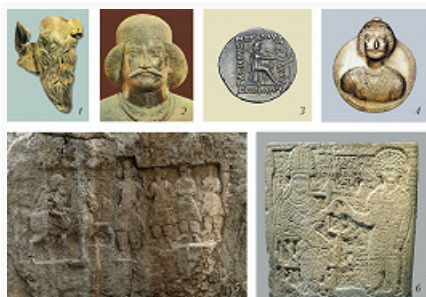
Парфянское царство. 1, 2 – находки

П. ц. имело сложную общественно-политич. структуру. Плиний Старший называл его объединением 18 царств. Были сохранены мн. гос. институты, существовавшие при Селевкидах. Видимо, среди парфян бытовало представление о принадлежности царской власти всему роду Аршакидов, что приводило к династич. конфликтам. При царе существовали два совета, один состоял из его родственников, другой – из магов . Считается, что огромным влиянием пользовались 7 знатных фамилий, обладавших традиц. привилегиями. Представители рода Суренов, в частности, получили право повязывать диадему на голову вновь избранного Аршака. На востоке П. ц. были сильны позиции кочевой аристократии. Греч. полисы, включённые в П. ц., во время войн с Селевкидами нередко выступали против парфян. В обмен на лояльность парфяне во многом сохранили традиц. уклад греческих, а до сер. 1 в. и вавилонских городов. Наряду с парфянским, официальным являлся греч. яз. Был широко распространён и арамейский яз. Соблюдалась веротерпимость.