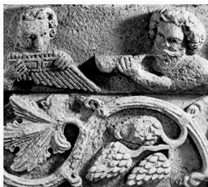
Фриз из Хатры. Фрагмент. Слева – музыкант с многоствольной флейтой. Известняк. Ок. 160. Музей Хатры (Хатра).

переосмыслили местные художники и ремесленники. В 1–2 вв. ведущая роль в создании произведений парфянского иск-ва уже принадлежала иранцам и семитам, обитавшим в П. ц. В скульптуре и живописи формируется «парфянский стиль», осн. особенностями которого М. И. Ростовцев считал фронтальность, иератичность, спиритуализм. В архитектуре самобытность местной культуры нашла отражение в создании особого конструктивного элемента – сводчатого айвана , ставшего украшением мн. дворцовых и культовых построек, напр. дворца в Ашшуре (1 в.). Важным декоративным элементом в архитектуре П. ц., а после его падения – ряда др. народов стала резьба по стуку ( стукко ). Мн. тенденции парфянского иск-ва получили развитие в сасанидский период.