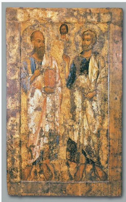
Апостол Павел. Фрагмент иконы из деисусного ряда иконостаса Благовещенского собора Московского Кремля. Приписывается Феофану Греку. Кон. 14 в. или 1405.

Известны также парные изображения апостолов Петра и П., которые интерпретируются как образ Церкви. Иногда апостолы изображаются держащими модель храма или предстоящими Кресту (иконы «Пётр и Павел» из Визант. музея в Афинах, сер. 14 в., и из ризницы мон. Хиландар на Афоне, 18 в.). К редкому варианту иконографии П. относится фреска в ц. Спаса мон. Жича в Сербии (ок. 1309–16), где П. изображён держащим на голове кодекс Евангелия (напротив – ап. Пётр с моделью храма); апостолы представлены здесь как столпы Церкви. С раннехристианского времени известен иконографич. тип «Объятия апостолов Петра и Павла» («Поцелуй мира», пряжка из слоновой кости 1-й четв. 5 в., Музей археологич. раскопок в Каstellамаре-ди-Стабия, мозаики Палатинской капеллы в Палермо, сев. капеллы собора в Монреале и др.).