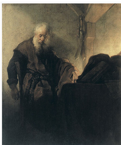
«Апостол Павел». Картина Рембрандта. 1635. Художественно-исторический музей (Вена).