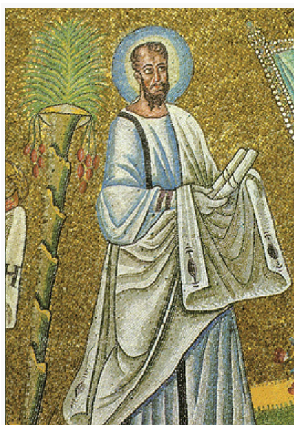
Апостол Павел. Фрагмент мозаики в куполе Арианского баптистерия в Равенне. 493–526.

В апокрифе «Деяния Павла и Фёклы» содержится одно из древнейших описаний внешности П. как человека низкорослого, лысого, «с ногами кривыми, с бровями сросшимися, с носом немного выступающим, полного милости...». Самые ранние изображения П. встречаются в росписях катакомб в Риме: Петра и Марцеллина (2-я пол. 3 – 1-я пол. 4 в.), Домициллы (сер. 4 в.), Претекстата (2-я пол. 4 в.), Комодиллы (4 в.). От ранневизант. периода дошли одиночные образы П. (бронзовая статуэтка кон. 4 в., Нац. археологич. музей, Кальяри). Несмотря на то, что П. не был среди 12 апостолов, его образ включается в их состав [мозаики баптистерия Православных, 451–475; Арианского баптистерия, 493–526; Архиепископской капеллы, 494–519; ц. Сан-Витале, 546–547 (все – в Равенне); ц. Св. Екатерины Синайского мон., 548–565].