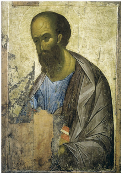
«Апостол Павел». Икона из так называемого Звенигородского чина. Приписывается Андрею Рублёву. Ок. 1400.

Авторы: Архим. Ианнуарий (Ивлиев), А. Г. Барков (иконография в византийском и древнерусском искусстве), А. В. Пожидаева (иконография в западноевропейском искусстве)