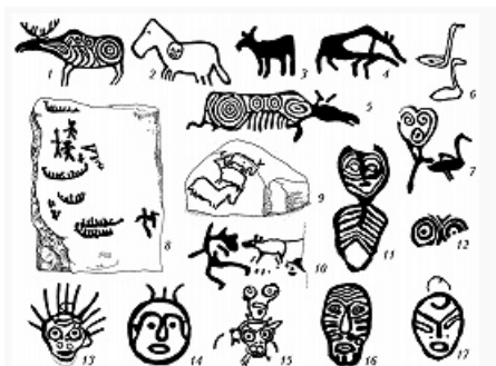
Петроглифы Нижнего Приамурья: 1–5, 8–17 – на базальтовых глыбах вблизи села Сикачи-Алян; 6, 7 – на скалах у села Шереметьево (по А. П. Окладникову).

покрытые оттисками шнура, орудия из пластин, микропризматич. нуклеусы и др.; получены радиоуглеродные даты 5070 и 5040 лет назад.