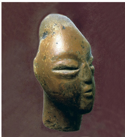
Ранний керамический неолит Греции. Голова терракотовой статуэтки. Суфли, Фессалия, Греция (по М. Гимбутас).

Древнейшие (1-я треть 7-го тыс. до н. э.) памятники докерамич. Н. в Европе известны на юге Балкан. Полагают, что эти традиции были привнесены с Ближнего Востока. Исследования генетиков подтверждают наличие нескольких волн миграции. Одна из них связана с появлением на Балканах в 1-й четв. 6-го тыс. до н. э. древнейшей крашеной и расписной керамики. Культуры Н. долго сосуществовали с культурами мезолитич. облика.