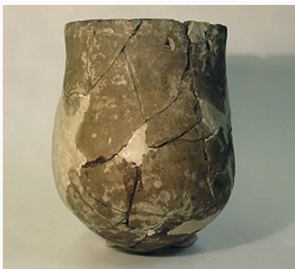
Ранний неолит Волго-Уральского региона. Керамический сосуд елшанской культуры. II Староелшанская стоянка, Оренбургская область России (по И. Б. Васильеву).

Неолитизация территорий к северу от Чёрного м. проходила в неск. этапов, ее отражает ряд культурных групп: в зап. областях – буго-днестровская культура ; в Нижнем Поднепровье и на степном Левобережье Днепра – сурская культура. По ряду признаков ей близки горнокрымская неолитическая культура , елшанская культура в лесостепи Волго-Уральского междуречья. Под влиянием буго-днестровской, сурской, азово-днепровской, нижнедонской культур раннего Н. формируется днепро-донецкая культурная общность среднего и позднего Н. Считается, что условная граница зон производящего и присваивающего хозяйства проходила в области Нижнего Поднепровья.