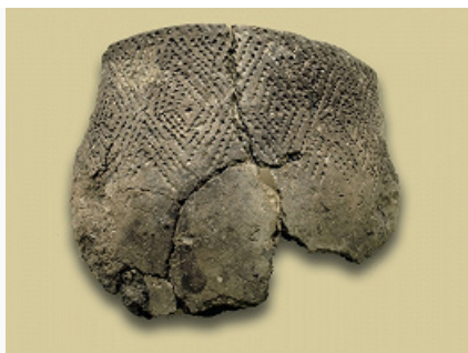
Поздний неолит Северного Прикаспия. Фрагмент керамического сосуда. Тентексор, Астраханская область России (по И. Б. Васильеву и А. А. Выборнову).

культура, в днепро-донецкую общность. Новый импульс из Повисленья привёл к формированию на припятско-неманском субстрате неманской культуры среднего и позднего Н., в которой отмечены начатки земледелия и животноводства.