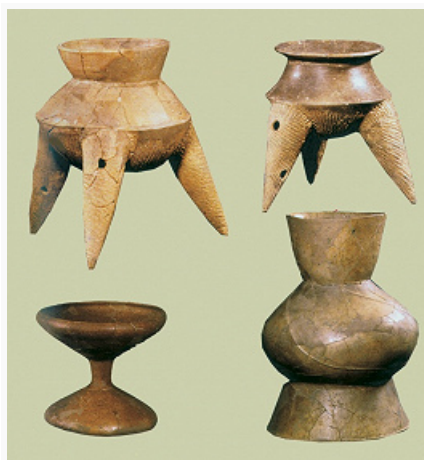
Ранний неолит Юго-Восточной Азии. Керамические сосуды. Бан-Као, Таиланд (по Ч. Хайему).

Более десятка археологич. культур Н. выделяют на территории рос. Дальнего Востока (см. в ст. Неолитические культуры Дальнего Востока ).