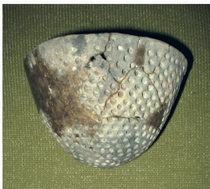
«Развитый» неолит Волго-Окского междуречья. Керамический сосуд льяловской культуры. Стоянка Сахтыш I, Ивановская область России (по Д. А. Крайнову).

Н. на Валдайской возвышенности, в верховьях Зап. Двины, Волхова, Волги, Днепра представлен валдайской культурой (кон. 6-го – нач. 3-го тыс. до н. э.).