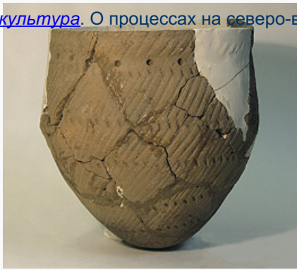
Поздний неолит Прикамья. Керамический сосуд. Стоянка Сауз II, Башкирия, Россия (по А. А. Выборнову).

культура . О процессах на северо-востоке Европы в Н. см. также раздел Исторический очерк в статьях Хомы и Пермский край .