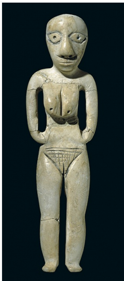
Неолит Верхнего Египта. Женская статуэтка из клыка гиппопотама. Бадарийская культура. Британский музей (Лондон).

территории Египта Древнего во многом неясны. Древнейшие памятники с начатками земледелия и скотоводства относятся здесь ко 2-й пол. 6-го тыс. до н. э. В Нижнем Египте поселения Н. разных традиций исследованы в Меримде-Бени-Саламе , Эль-Омари ; в 4-м тыс. до н. э. тут развиваются уже энеолитич. культуры ( Маади и др.). Особая культура Файюм сложилась в Файюмском оазисе. Для Верхнего Египта выделяют тасийскую культуру, которая была предшественником или локальным вариантом бадарийской культуры (есть гипотеза о её связи с традициями восточносahарских центров). По-видимому, на этой основе развивался ряд культур Нагада (I – амратская культура, относящаяся к Н., хотя известны изделия из меди; II – герзейская культура энеолита, распространившаяся и на Нижний Египет; III – протодинастич. период). Есть точка зрения, что с бадарийскими традициями связана неолитич. хартумская культура в районе слияния Белого Нила и Голубого Нила.