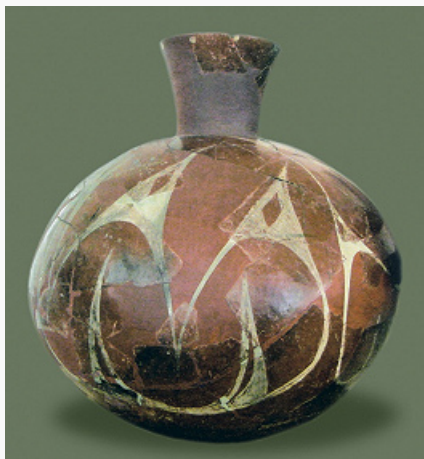
Ранний неолит Балкан. Расписной керамический сосуд. Велушка-

культуры Кёрёш (Криш) стал смещаться к востоку, а в бассейне Прута особенно долго сохранялись её пережиточные формы.