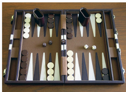
Современный комплект для игры в нарды

часовой стрелке, а чёрные – против часовой.