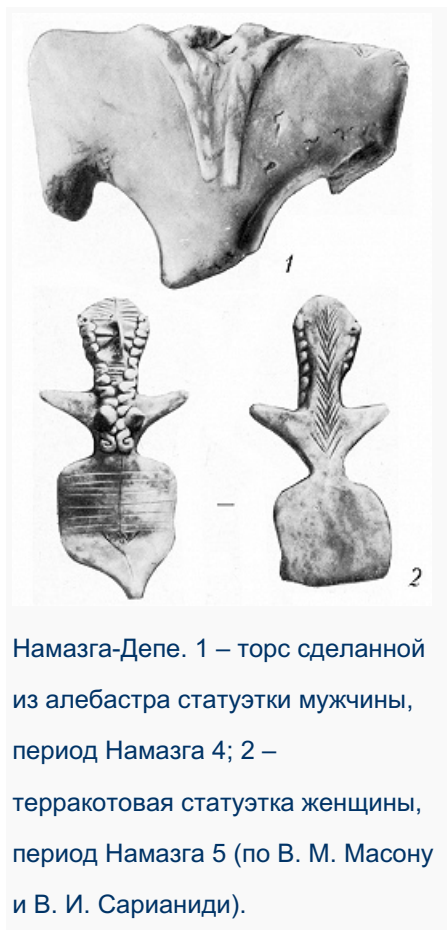
Намазга-Депе. 1 – торс сделанной из алебаstra статуэтки мужчины, период Намазга 4; 2 – терракотовая статуэтка женщины, период Намазга 5 (по В. М. Масону и В. И. Сарияниди).

стрелы. В Н.4 появляется посуда, сделанная на гончарном круге, тесто однородное или с мельчайшими примесями; преобладают светлоангобированные кубки, цилиндрич. и биконич. миски, часто на поддоне; роспись монохромная, в осн. геометрическая, элементы становятся меньше, композиция сложнее, есть детализированные изображения козлов (с 2 или 4 ногами и проработанной мордой), деревьев, птиц; отмечается деградация традиции росписи, к концу Н.4 она исчезает. Среди др. находок – медные булавки с биспиральным завершением, терракотовые статуэтки сидящих женщин с одной опущенной рукой и другой, согнутой в локте и поднесённой к лицу; глиняная фигурка стоящего мужчины с расставленными ногами; уникален сохранившийся торс крупной статуэтки из алебаstra с прямыми плечами, опущенными отрезками рук и рельефными полосами вокруг шеи, спускающимися на грудь и спину, голова к торсу крепилась на штыре.