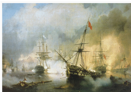
«Морское сражение при Наварине