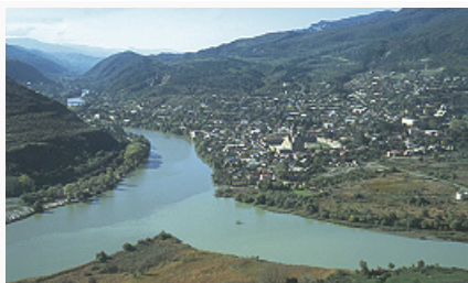
Мцхета. Вид города от монастыря Джвари.

По легенде, М. основана во 2-й пол. 1-го тыс. до н. э. сыном первого груз. царя Мцхетосом. По археологич. данным, как город М. формировался с 4 в. до н. э. С 3 в. до н. э. — столица вост.-груз. гос-ва Картли (см. Иберия ). В 65 до н. э. временно захвачена рим. полководцем Гнеем Помпеем . Несмотря на перенос столицы в 6 в. в Тифлис (ныне Тбилиси) и разрушения в 730-е гг. в ходе арабских завоеваний , М. до 19 в. оставалась местом коронации и захоронения груз. царей, а также резиденцией главы Грузинской православной церкви — католикоса-патриарха. После восстановления автокефалии Груз. православной церкви (1917) М. вновь стала резиденцией её предстоятелей. С 15 в. значит. городской и торгово-ремесленный центр Картлийского государства , с 1762 — Картли-Кахетинского царства. С 1801 в составе Рос. империи, с 1921 — Груз. ССР, с 1991 — Грузии.