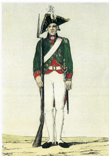
«Мушкетёр лейб-гвардии Семёновского полка». Художник К. Гейслер. Раскрашенная гравюра. 1780-е гг. Эрмитаж (С.-Петербург).

МУШКЕТЁРЫ (франц. mousquetaire, от mousquet – мушкет), 1) воины, имевшие на вооружении мушкеты ; 2) разновидность пехоты в армиях Зап. Европы 16–17 вв. и в рос. армии 17 – нач. 18 вв.; 3) воины пех. частей рос. и некоторых зап.-европ. армий 18 – нач. 19 вв., носившие это наименование по традиции.