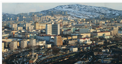
Мурманск. Вид города.

МУРМАНСК, город в России, адм. центр Мурманской обл. Нас. 307,3 тыс. чел. (2010, перепись), крупнейший в мире по числу жителей город за Сев. полярным кругом. Расположен в зоне распространения многолетнемерзлых пород, на скалистом побережье Кольского зал., в 50 км от выхода в Баренцево море. Крупный транспортный узел. Ж.-д. станция. Через М. проходит федеральная автомагистраль «Кола» (С.-Петербург – Петрозаводск – Мурманск – Борисоглебский/граница с Норвегией). Мор. порт. Междунар. аэропорт (к юго-западу от М., близ пос. гор. типа Мурмаши).