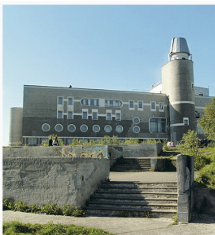
Мурманск. Дворец детского творчества «Лапландия». 1985.

Осн. часть М. расположена вдоль вост. побережья Кольского зал. Застройка, растянувшаяся примерно на 19 км, поднимается от залива несколькими террасами. До 1950-х гг. в городе преобладали дерев. здания (дома кон. 1920-х – 1930-х гг. в р-не Жилстрой). В центре М. расположены пл. Пять Углов и отд. здания кон. 1920-х – 1930-х гг.: первое каменное здание – магазин транспортно-потребительского об-ва (1927; ныне худож. музей: рус. живопись 18–20 вв., нар. иск-во Рус. Севера), мор. техникум в стиле конструктивизма (1931–33; с 1996 здесь размещается технич. ун-т), Областной дворец культуры им. С. М. Кирова (1929–34, арх. Н. А. Митурич; восстановлен с применением коринфского ордера в 1946–49); школа в стиле сов. неоклассицизма (1937, реконструирована в 1956 для краеведч. музея).