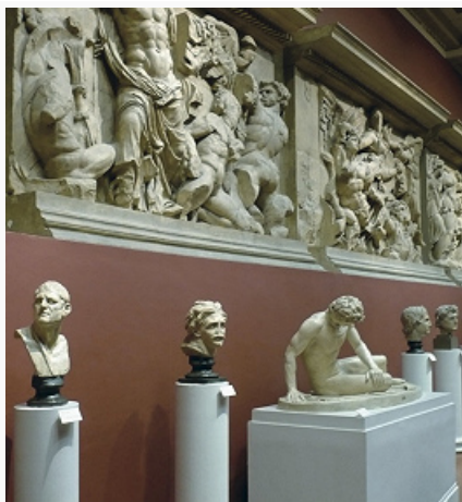
Музей изобразительных искусств. Зал слепков с произведений эпохи эллинизма.