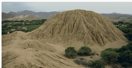
Мочика. Платформа из сырцового кирпича в Сипане.

МОЧЬКА, Моче (Mochica, Moche), археологич. культура (ок. 100–750) на территории сев. побережья Перу, одна из крупнейших цивилизаций в Юж. Америке до инков. Открыта нем. археологом М. Уле в 1899 в ходе раскопок могильников в долине Моче близ совр. г. Трухильо и была названа «прото-Чиму» по сходству керамики и иконографии с Чиму (в 1925 назв. «раннее Чиму» ввёл амер. этнолог А. Л. Крёбер). Назв. «М.» дано перуан. археологом-любителем Р. Ларко Ойле в 1930-х гг. — от яз. мучик, на котором до 18 в. говорили индейцы в долинах от Хекетепеке до Лече;