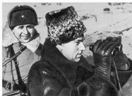
Командующий 16-й армией генерал-лейтенант К. К. Рокоссовский. Фото. Зима 1941–42.

дальнебомбардировочная авиация. Так как сов. войска понесли большие потери в оборонит. операции, Ставка ВГК в конце ноября – начале декабря передала из резерва 10-ю, 1-ю ударную и 20-ю армии на усиление Зап. фронта. Кроме того, фронт получил 9 стрелк. и 2 кав. дивизии, 8 стрелк. и 6 танковых бригад и др. Несмотря на это, сов. войска уступали германским в живой силе в 1,5 раза, в артиллерии – в 1,8, в танках – в 1,5 раза и только в самолётах превосходили в 1,6 раза. Однако командование РККА, учитывая измотанность герм. войск, отсутствие у них подготовленной обороны и оперативных резервов, их неготовность к ведению боевых действий в зимних условиях, приняло решение о проведении операции.