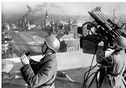
На страже московского неба. Фото. Осень 1941.

уже был не способен продвигаться вперёд и в то же время ещё не успел закрепиться на захваченных рубежах. Создались условия для перехода сов. войск в контрнаступление под Москвой.