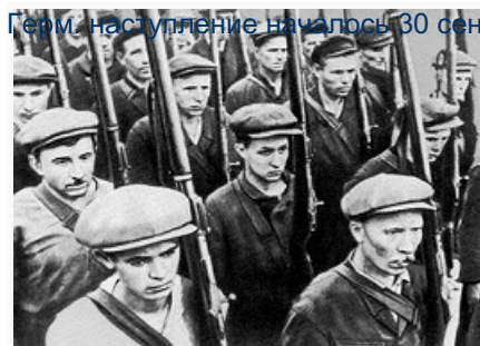
Ополченцы. Фото 1941.

Герм. наступление началось 30 сент. на брянском и 2 окт. на вяземском направлениях. Несмотря на упорное сопротивление сов. войск, противник 6 окт. вышел в район западнее Вязьмы и окружил 4 армии Западного и Резервного (10 окт. объединён с Западным) фронтов. Своими активными действиями в окружении эти армии сковали 28 герм. дивизий; 14 из них не могли продолжать наступление до середины октября. Тяжёлая обстановка сложилась и в полосе Брянского фронта. Его армии, прорываясь из окружения, вынуждены были отходить. Войска Калининского фронта (создан 17 окт.) во 2-й пол. октября остановили наступление герм. 9-й армии, заняв охватывающее положение по отношению к левому крылу группы армий «Центр». К началу нояб. 1941 на зап. направлении сохранялась крайне тяжёлая обстановка. Сплошной линии обороны не было, резервов, способных в короткий срок закрыть бреши, командования фронтов не имели. В этой обстановке Ставка ВГК приняла решение о создании нового стратегич. фронта обороны. Гл. рубежом сопротивления на подступах к Москве была определена Можайская линия обороны, на которую выдвигались резервы Ставки и войска с др. направлений.