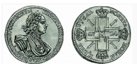
Рисунок Р. И. Маланичева Рубль, изготовленный на С.- Петербургском монетном дворе. 1724.

Во время Вел. Отеч. войны по поручению СНК СССР для изготовления орденов и медалей СССР открыт Московский монетный двор (1942; в 2006 получил статус филиала ФГУП «Гознак» Мин-ва финансов РФ), со временем стал крупнейшим М. д. в стране. В 1977–78, наряду с Ленинградским М. д., участвовал в чеканке нескольких серий золотых и серебряных монет, посвящённых XXII летним Олимпийским играм в Москве. В нач. 1980-х гг. специалисты Моск. М. д. впервые в мировой практике применили поточно-механизир. способ изготовления монет с использованием автоматизир. систем обработки изделий. Ныне изготавливает разменную монету, памятные монеты из цветных и драгоценных металлов, гос. награды и знаки отличия, нагрудные знаки и значки, памятные и юбилейные медали, золотые наручные часы и пр.