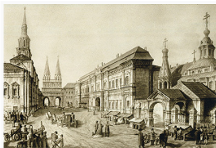
Новый Красный (Китайский) монетный двор в Москве. Раскрашенная гравюра. 1802.

МОНЁТНЫЙ ДВОР, предприятие, занимающееся чеканкой монет (в т. ч. памятных из драгоценных металлов), изготовлением орденов, медалей и др. металлч. знаков отличия. Первые М. д. возникли в период античности в странах Средиземноморья. В 9–10 вв. в связи с массовой чеканкой денариев в странах Зап. Европы М. д. появились в значит. количестве, однако штат большинства М. д. не превышал 5–12 работников. В 13–14 вв. число М. д. за счёт закрытия мелких М. д. значительно сократилось, произ-во монеты сосредоточилось, как правило, в крупных городах или вблизи серебряных и медных рудников. В кон. 19 – нач. 20 вв. чеканка монеты большинства европ. государств стала осуществляться на крупнейших М. д. Ныне действуют М. д. в городах Кремница (Словакия; с 1328), Вашингтон (США; с 1792), Бирмингем (Великобритания; с 1794), Берн (Швейцария; с 1906) и др.