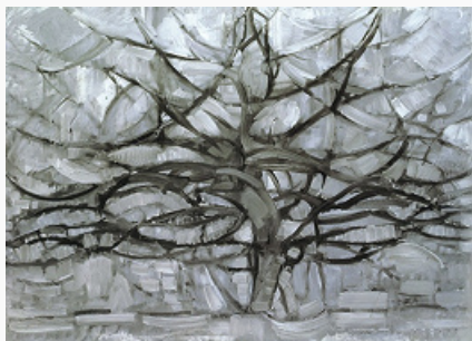
П. Мондриан. «Серое дерево». 1912. Частное собрание.