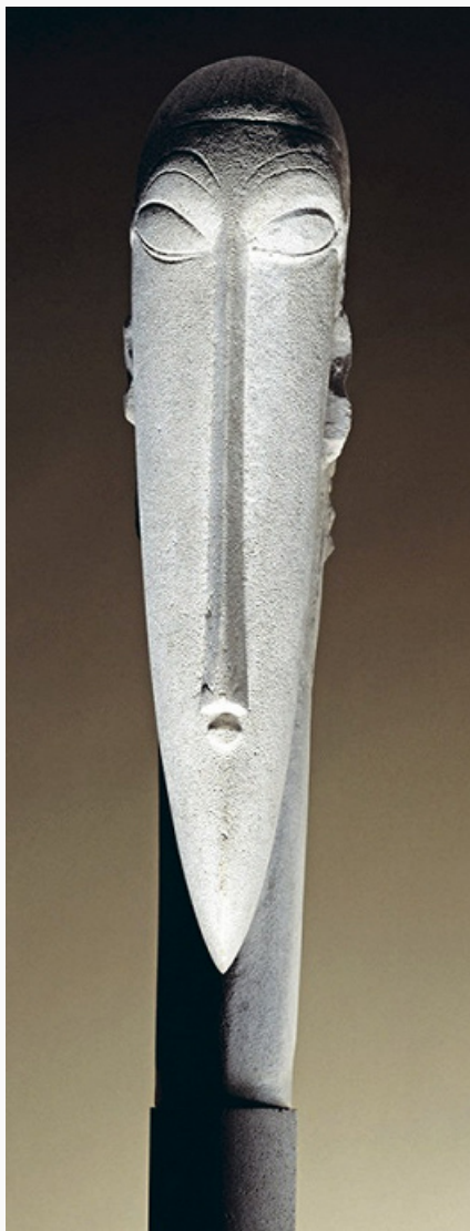
А. Модильяни. «Женская голова». Песчаник. Ок. 1911. Галерея Тейт (Лондон).