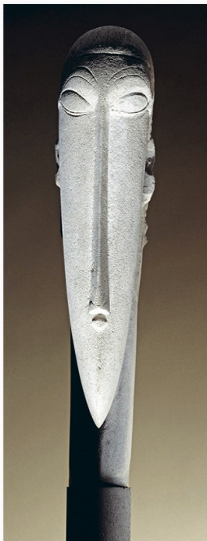
А. Модильяни. «Женская голова». Песчаник. Ок. 1911. Галерея Тейт (Лондон).