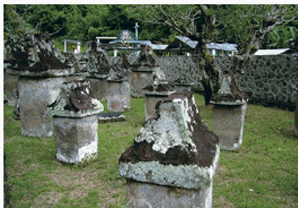
Минахасцы. Кладбище в городе Манадо. Погребальные ящики варуга.

МИНАХА́СЦЫ (минахасы), группа сулавесийских народов в Вост.