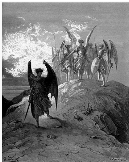
Иллюстрация Г. Доре к «Потерянному раю» Дж. Мильтона (1866).

Замысел поэмы на библейский сюжет грехопадения возник у М. ещё в молодости. М. были известны пьесы Й. ван ден Вондела на тот же сюжет – «Люцифер» (1654) и «Адам в изгнании» (1664). Поэма, продолжившая традиции эпич. поэзии античности (Гомер, Вергилий, Овидий) и Возрождения (Данте, Т. Тассо), написана в жанре христианской учёной эпопеи; она включает в себя также жанры шестоднева (рассказа о Сотворении мира), маски, оды, гимна, эклоги и т. д.