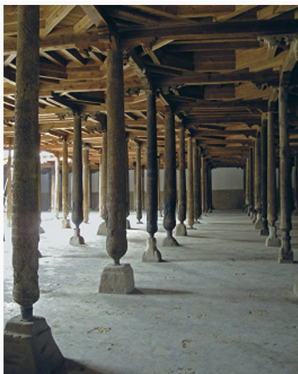
Джума-мечеть в Хиве (Узбекистан). Внутренний двор. Кон. 18 в.

первые века ислама соборная М. нередко исполняла также функции духовной школы, богословского центра, приюта паломников или суфиев, места погребения основателя (М.-университеты – аль-Карауин в Фесе, сер. 9 в., аль- Азхар в Каире, 970–972). Главная (или единственная) джами (джума) города получала статус Большой мечети. Осн. принципы структуры мусульм. соборного здания определились в Медине, в процессе организации в 622 и позднее места коллективных молений при Доме Мухаммеда (позднее Мечеть Пророка), планировка которого, по мнению англ. учёного К. А. К. Крезуэлла, повторила схему доисламского жилища вождя племени. По сообщению Ибн Сада, биографа Мухаммеда, собственно М. служил примыкавший к дому с запада просторный двор, окружённый 7-метровой сырцово-кирпичной стеной на каменном фундаменте, с 3 входами; на северной (в направлении к Иерусалиму), а затем и на южной, обращённой к Мекке стороне были созданы зоны тени – навесы из скреплённых глиной пальмовых листьев, положенных на стволы пальм. Композиция Мечети Пророка, сложившаяся к сер. 7 в., стала отправной точкой в развитии соборной М. колонного, или арабского, типа. По её образцу устраивались походные М. араб. отрядов: начертанный на земле квадрат с копьём, воткнутым на стороне киблы.