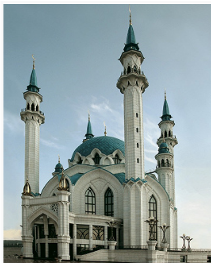
Мечеть Кул-Шариф в Казанском кремле. 1996–2005. Архитекторы А. Г. Саттаров, И. Ф. Сайфуллин, М. В. Сафронов, Ш. Г. Латыпов; главный архитектор проекта А. В. Головин.

куполом и входным айваном внутри парадной порталной рамы – пештака (мечети Биби-Ханым в Самарканде, 1405, Калян в Бухаре, 15–16 вв.). Наиболее эффектное и грандиозное решение тип иранской М. получил в султанских и шахских джами Бухары, Самарканда, Герата, Исфахана, Тебриза в 15–17 вв. В отличие от более ранних зданий с глухими наружными стенами, соборные мечети Тимуридов, Шейбанидов, Сефевидов, как и построенные по той же схеме большие медресе, получали красочное оформление фасадов, теперь обращённых на парадную гор. площадь нарядным монументальным порталом. Идея неограниченной власти монарха в этих грандиозных сооружениях нашла выражение не в изменении композиционно-планировочной схемы, а в увеличении масштаба объёмов, акцентирующих осн. части здания так же, как и включение орнаментального цветного декора. С эпохи Тимуридов (1370–1507) на Востоке исламского мира пештак с айваном, украшенным внутри сводом со сталактитами и многоцветным ковром из расписной и наборной керамики, стал обязательным и универсальным оформлением любого монументального здания с айванной композицией.