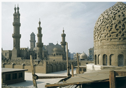
Мечеть аль-Азхар в Каире. 970–972 (перестраивалась).

первые века ислама соборная М. нередко исполняла также функции духовной школы, богословского центра, приюта паломников или суфиев, места погребения основателя (М.-университеты – аль-Карауин в Фесе, сер. 9 в., аль- Азхар в Каире, 970–972). Главная (или единственная) джами (джума) города получала статус Большой мечети. Осн. принципы структуры мусульм. соборного здания определились в Медине, в процессе организации в 622 и позднее места коллективных молений при Доме Мухаммеда (позднее Мечеть Пророка), планировка которого, по мнению англ. учёного К. А. К. Крезуэлла, повторила схему доисламского жилища вождя племени. По сообщению Ибн Сада, биографа Мухаммеда, собственно М. служил примыкавший к дому с запада просторный двор, окружённый 7-метровой сырцово-кирпичной стеной на каменном фундаменте, с 3 входами; на северной (в направлении к Иерусалиму), а затем и на южной, обращённой к Мекке стороне были созданы зоны тени – навесы из скреплённых глиной пальмовых листьев, положенных на стволы пальм. Композиция Мечети Пророка, сложившаяся к сер. 7 в., стала отправной точкой в развитии соборной М. колонного, или арабского, типа. По её образцу устраивались походные М. араб. отрядов: начертанный на земле квадрат с копьём, воткнутым на стороне киблы.