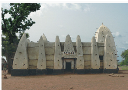
Мечеть в деревне Ларабанга

позднее перестраивались из христианских церквей или возводились заново с частичным использованием древних построек.