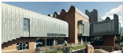
Музей Людвига в Кёльне. 1986.