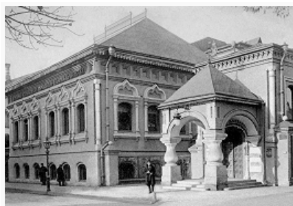
Музей кустарных изделий в Москве.

С. И. Мамонтов и М. К. Тенишева активно способствовали развитию целых отраслей нового рус. искусства (оперы – Частная русская опера; иск-ва театральной декорации и декоративно-прикладного иск-ва – мастерские в Талашкино ), воссозданию рус. стиля в изобразит. иск-ве, положили начало финансированию ж. «Мир искусства» (1898).