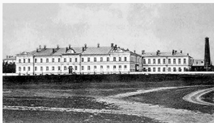
Кунгурское техническое училище имени А. С. Губкина. Почтовая открытка. Нач. 20 в.